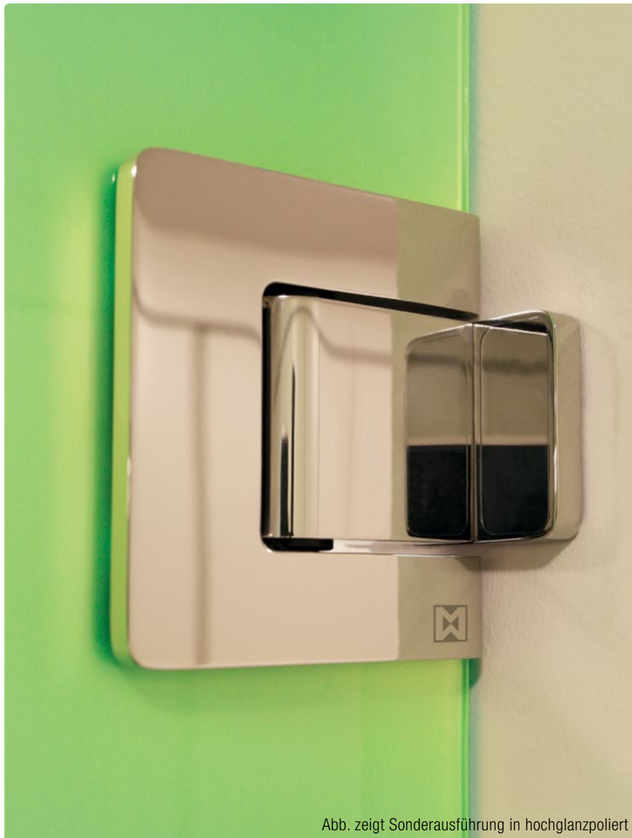
Abb. zeigt Sonderausführung in hochglanzpoliert