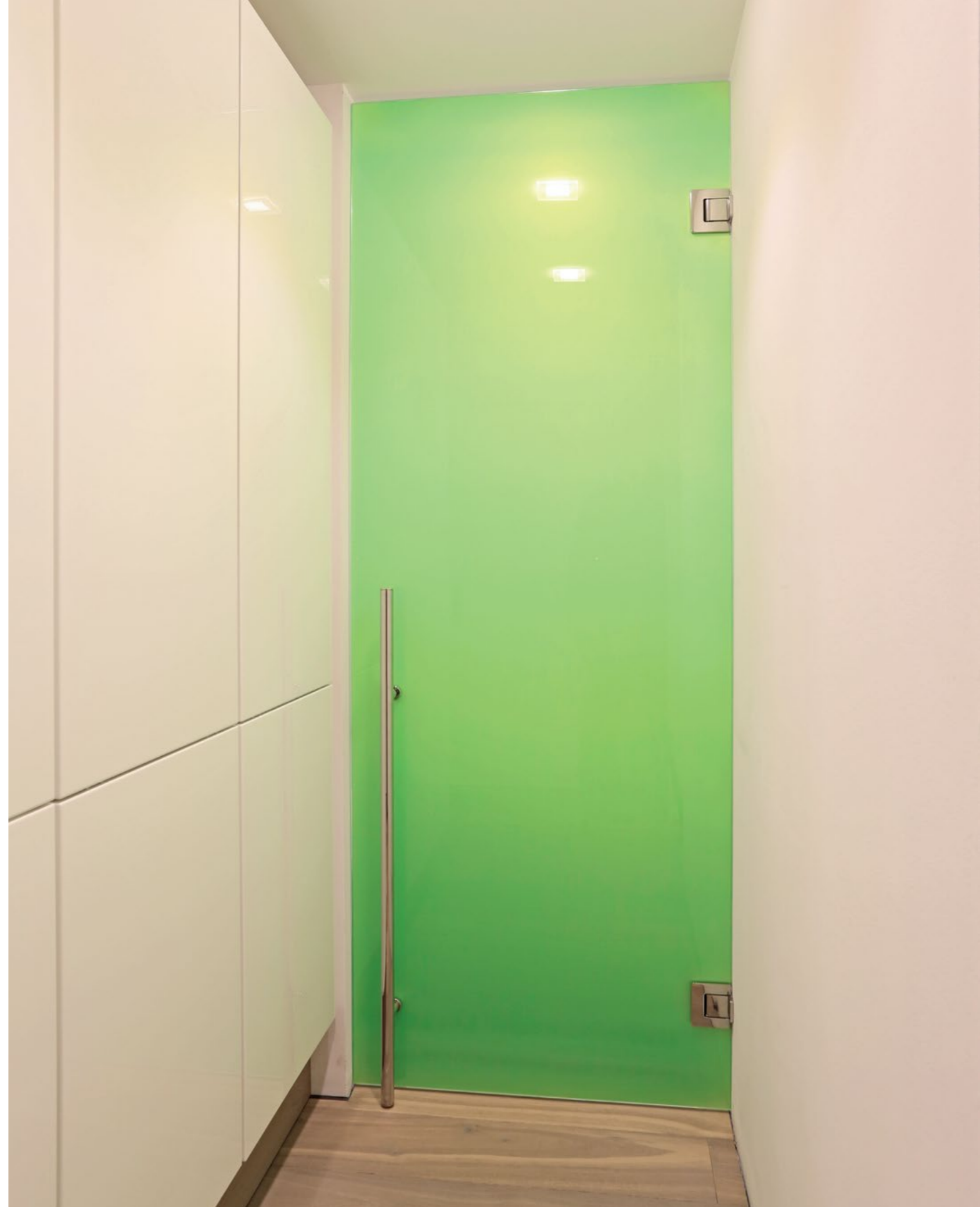
Pendeltürband Agitus PT.7110 für Wandanbindung