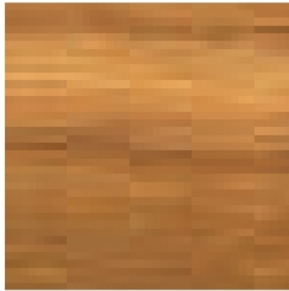
Eiche / chêne